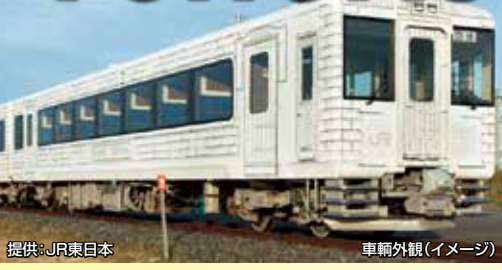
車輦外観(イメージ)