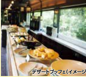
デザートbuffet(イメージ)

「TOHOKU EMOTION」はコンパートメント個室車輛、ライブキッチンスペース車輛、オープンダイニング車輛の3両編成で八戸→久慈間を走ります。三陸の海を眺めながら、お食事とスイーツを堪能できる「走るレストラン」は全席レストラン空間!!