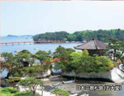
日本三景松島(五大堂)