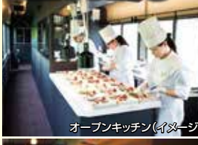
オープンキッチン(イメージ)