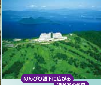
のんびり眼下に広がる 洞爺湖の絶景