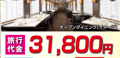
オープンダイニング(イメージ)