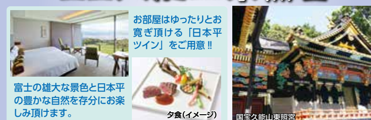
国宝久能山東照宮