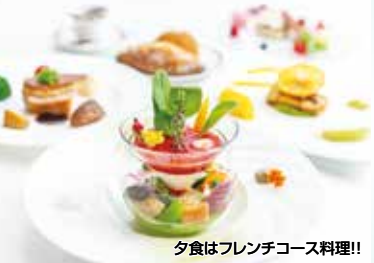
夕食はフレンチコース料理!!