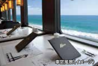
車窓風景(イメージ)

「TOHOKU EMOTION」はコンパートメント個室車輛、ライブキッチンスペース車輛、オープンダイニング車輛の3両編成で八戸→久慈間を走ります。三陸の海を眺めながら、お食事とスイーツを堪能できる「走るレストラン」は全席レストラン空間!!